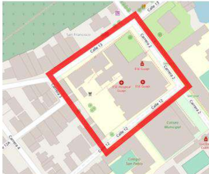
Localización en manzana puntual E.S.E. E GUAPI.