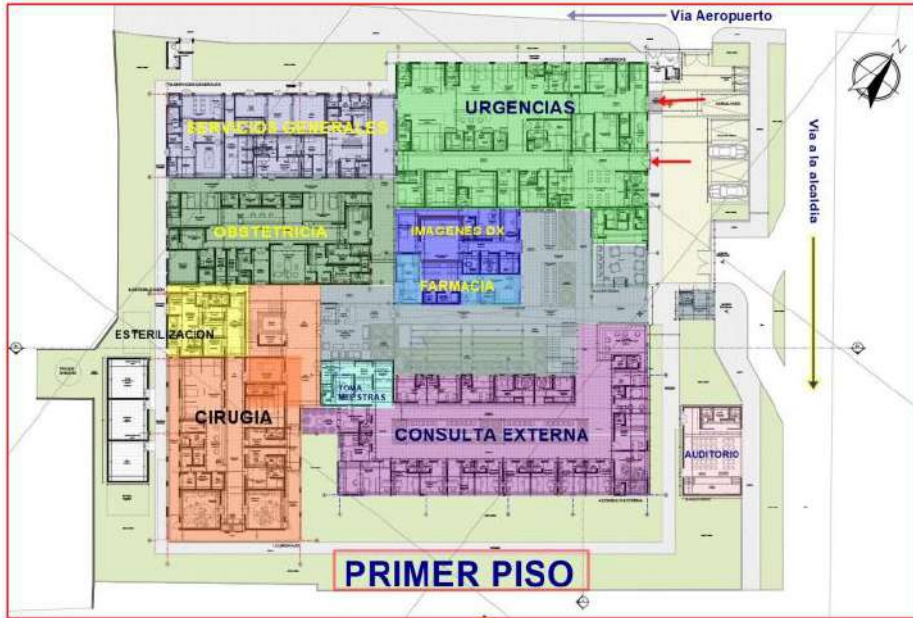
Fuente Informe propuesta arquitectónica