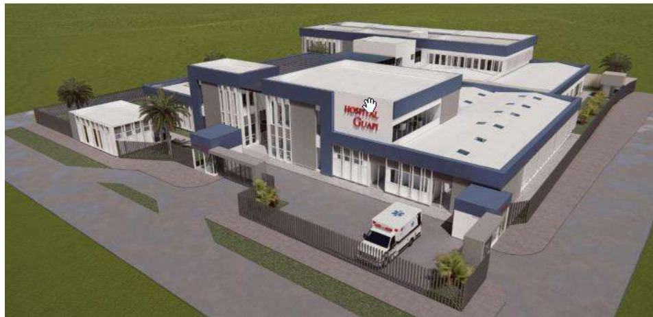
Imagen de referencia acceso principal al Hospital